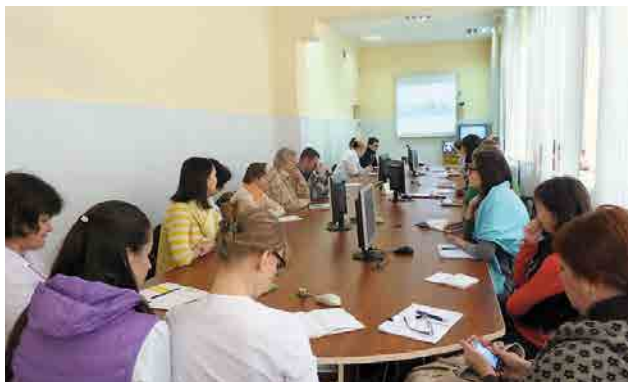
Робота «Української школи АД»

В грудні 2014 р. МОЗ України затвердило графік телемедичних конференцій «Українська школа АД» на 1-ше півріччя 2015 р. Із запланованої тематики відбулись: 20 січня 2015 р. – лекція завідуючої кафедри дитячих та підліткових захворювань НМАПО ім. П.Л. Шупика, д.м.н., професора Г.В. Бекетової «Гельмінтози. Паразитози»; 10 лютого 2015 р. – лекція