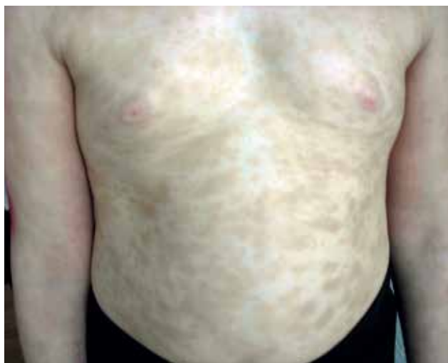
Рис. 2. Пациент П., тип II мастоцитоза: пигментная крапивница, болеет с 1,5-годовалого возраста