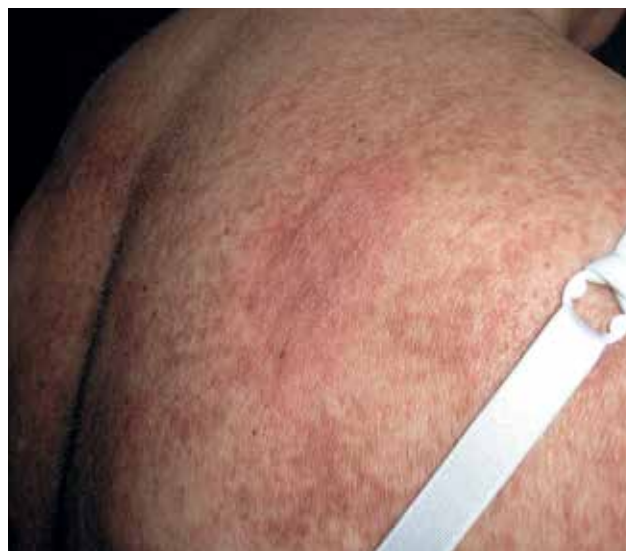
Рис. 7. Пациентка Л., 62 года, тип III мастоцитоза: пигментная крапивница (признак Дарье), болеет с 35 лет