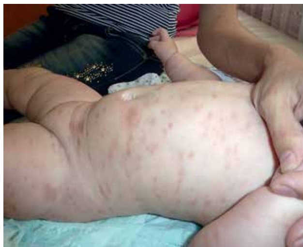
Рис. 3. Пациент С., 6 мес., тип III мастоцитоза: диффузный мастоцитоз