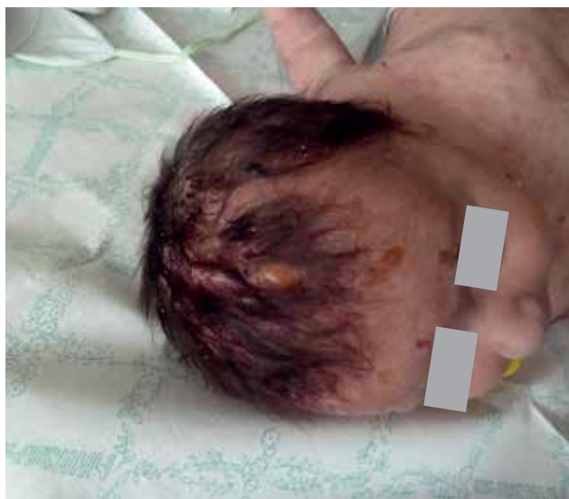
Рис. 6. Пациент С., 10 мес., тип III мастоцитоза: диффузный буллезный мастоцитоз, болеет с 6-месячного возраста