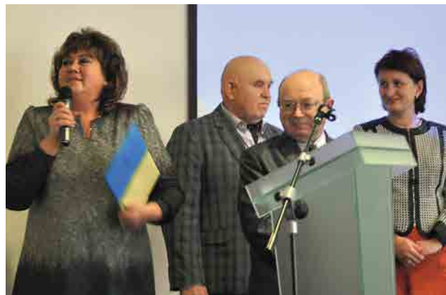
Виступ голови медичного профспів'язу Харківської області

Професор Вітебського державного медичного університету (Білорусь) В.П. Адашкевич від душі привітав українських колег та побажав їм творчих успіхів у справі збереження здоров'я українського народу.