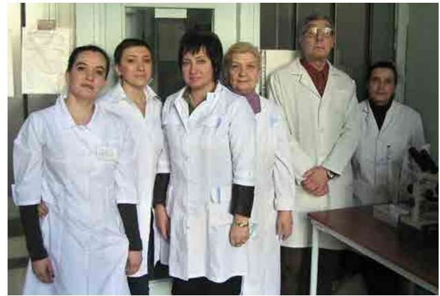
Сотрудники лаборатории микробиологии