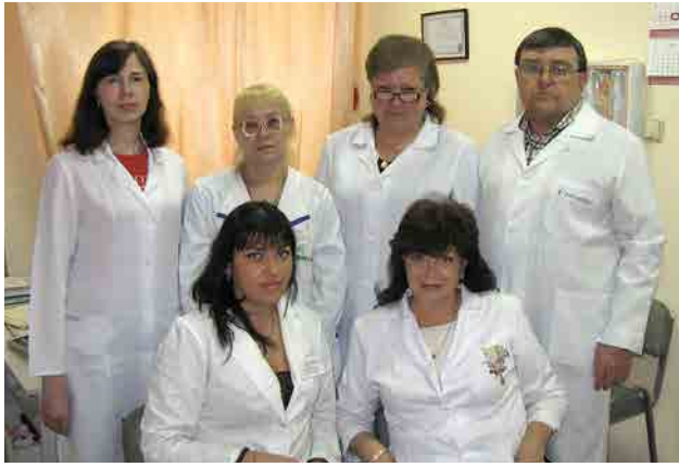
Сотрудники консультативной поликлиники