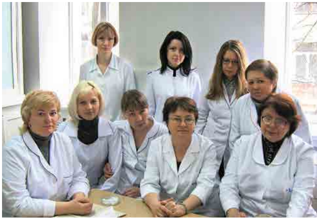
Сотрудники отдела дерматологии, инфекционных и паразитарных заболеваний кожи