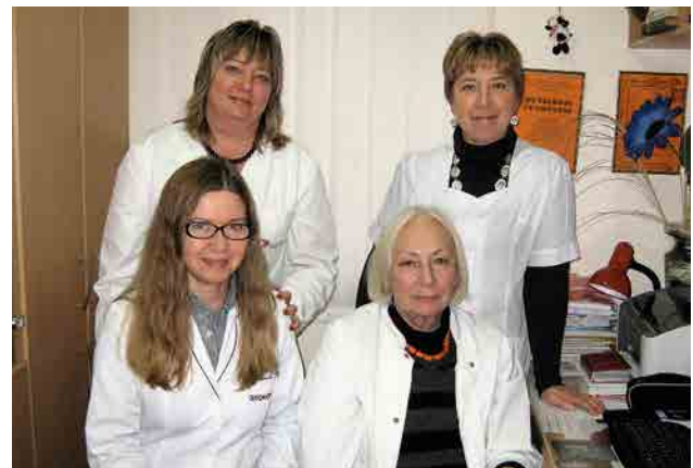
Сотрудники лаборатории аллергологии