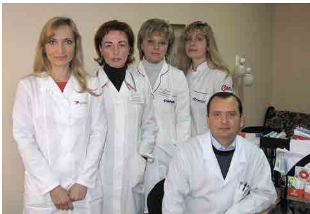
Сотрудники отдела инфекций, передающихся половым путем