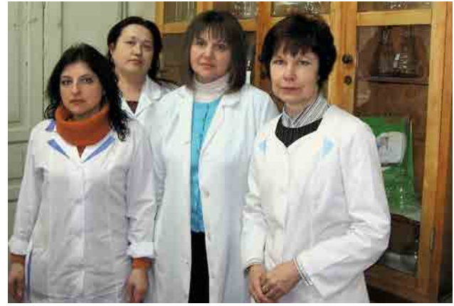
Сотрудники лаборатории биохимии