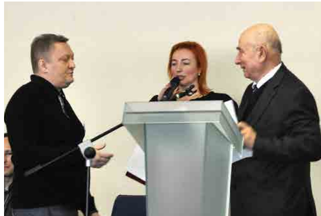
Нагородження почесними грамотами