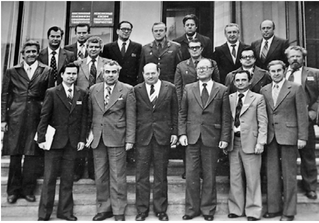
Встреча видных ученых страны (80-е годы)

поколения – урогенитального хламидиоза, микоплазмоза, уреаплазмоза, вирусных инфекций, сифилиса и др.