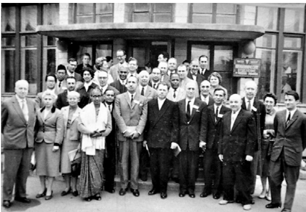
Семинары ВОЗ (июль и октябрь 1965 г.) в Харькове