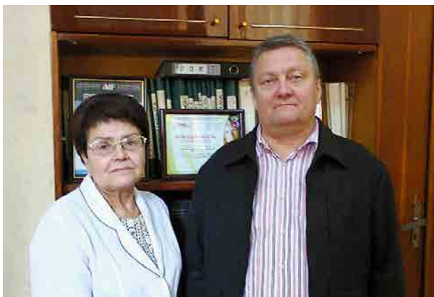
Сотрудники отдела научно-аналитической работы в дерматологии и венерологии

В последние годы набирают обороты научные исследования по усовершенствованию метода ПЦР диагностики ИППП, выявления признаков резистентности бледной спирохеты к некоторым лекарственным средствам, разработки методов диагностики, лечения тяжелых, распространенных дерматозов, методов профилактики и лечения инфекционных поражений кожи с целью обеспечения эпидемиологической безопасности населения.